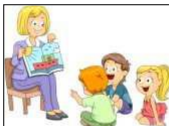
3. I discorsi e le parole