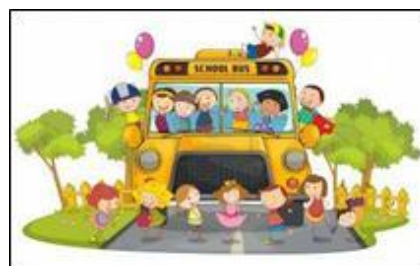
5. La conoscenza del mondo