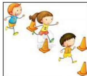
2 Il corpo e il movimento