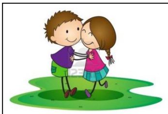
1. Il sé e l'altro

Per rispondere a questi bisogni le educatrici hanno elaborato la programmazione annuale sui seguenti cinque "campi di esperienza" intesi come luoghi del fare e dell'agire del bambino.